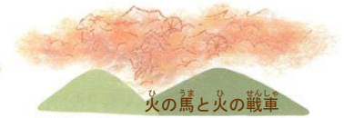
火の馬と火の戦車