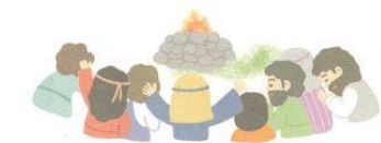
契約とミツバ運動